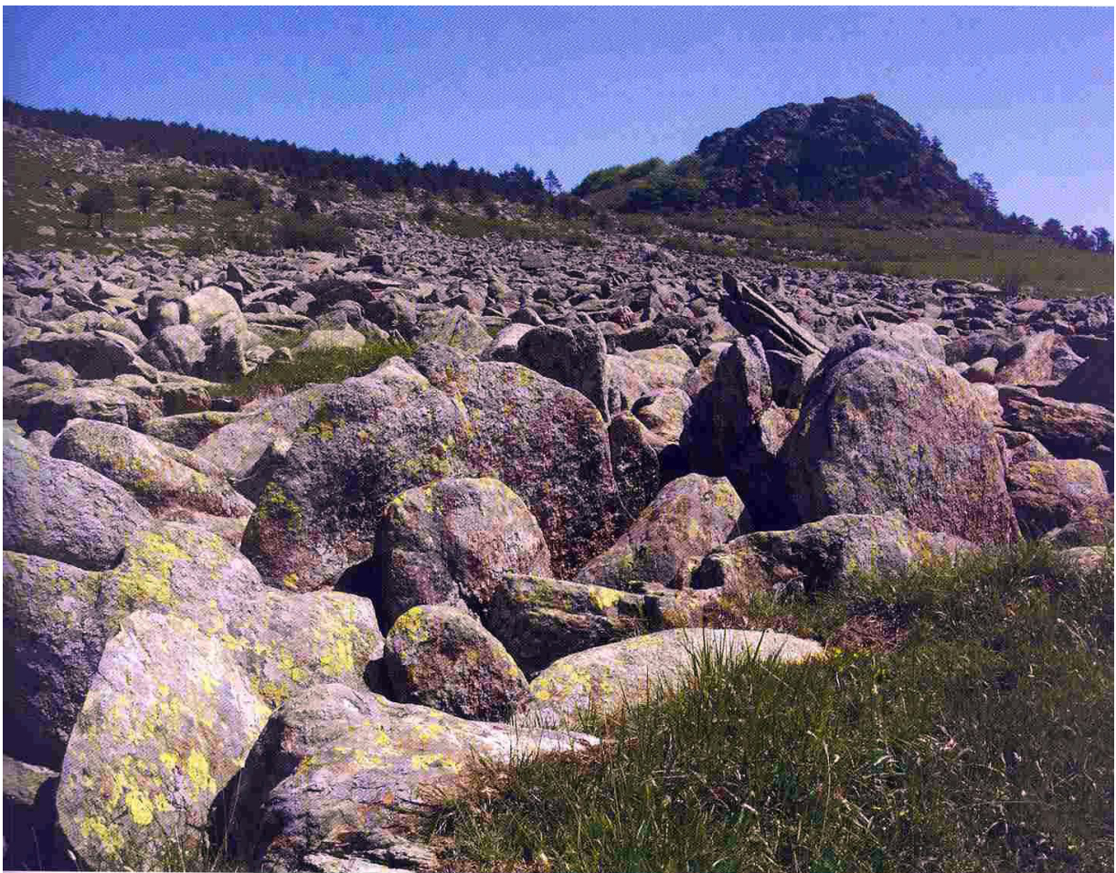
Fig. 59. Fiumi di pietra in località Pian Fretto (SV).

Impronta fossile di foglia, arenarie e marne in loc. S. Giustina