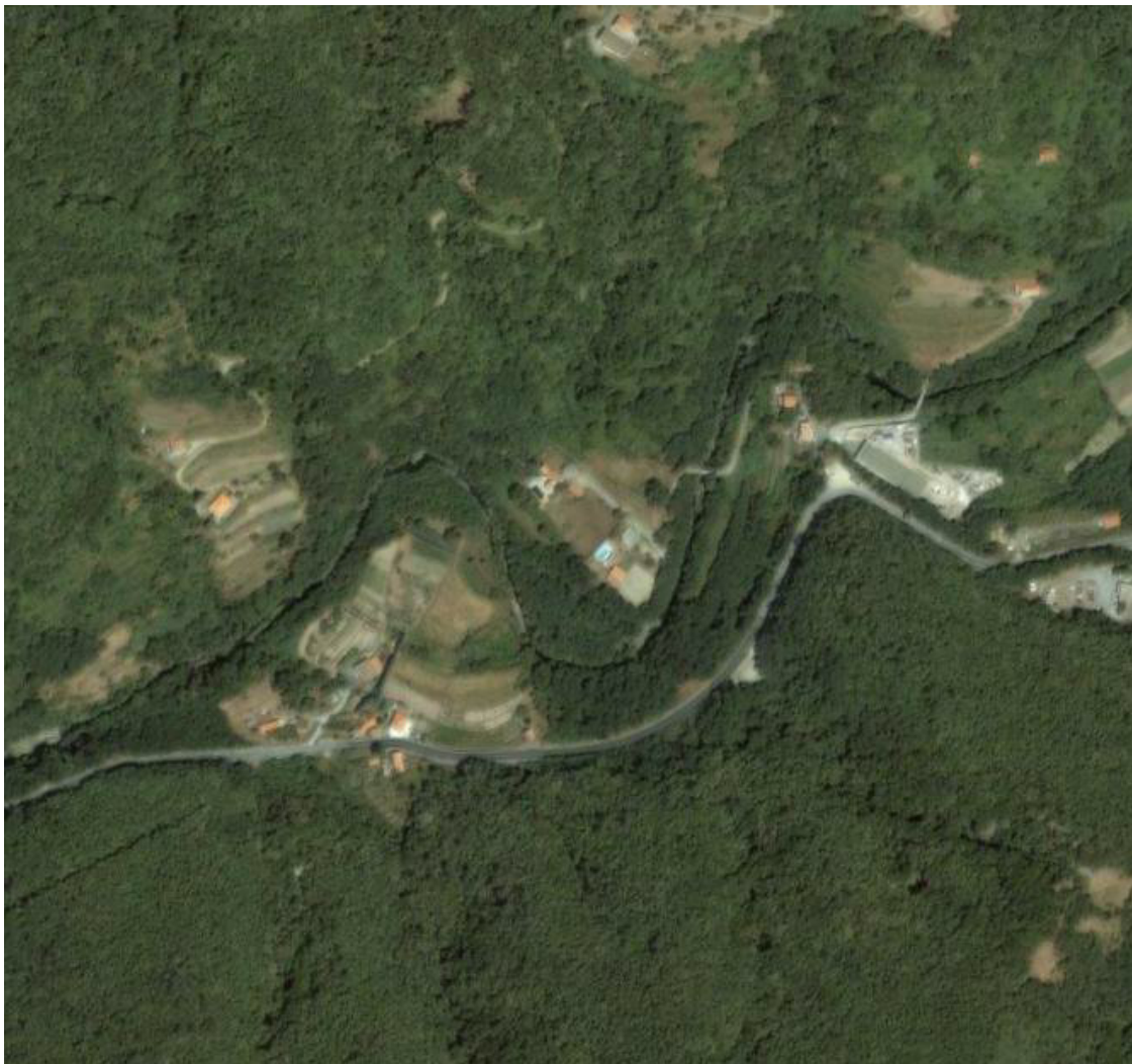
Geosito n° 2168: Meandri del T. Sansobbia in loc. Case Vesca